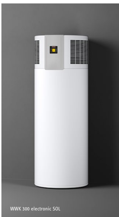
WWK 300 electronic SOL

Warmwasser-Wärmepumpe WWK 220/300 electronic (SOL)